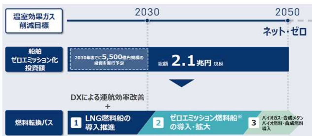
ネット・ゼロエミッション達成へ向けたロードマップ

新たなNYKグループESGストーリーと中期経営計画においては、2050年の目標が50%削減からネット・ゼロに上方修正されるとともに、2022-2050年の投資総額として4.8兆円、そのうち船舶のゼロエミッション化の投資額が2.1兆円と開示しています。